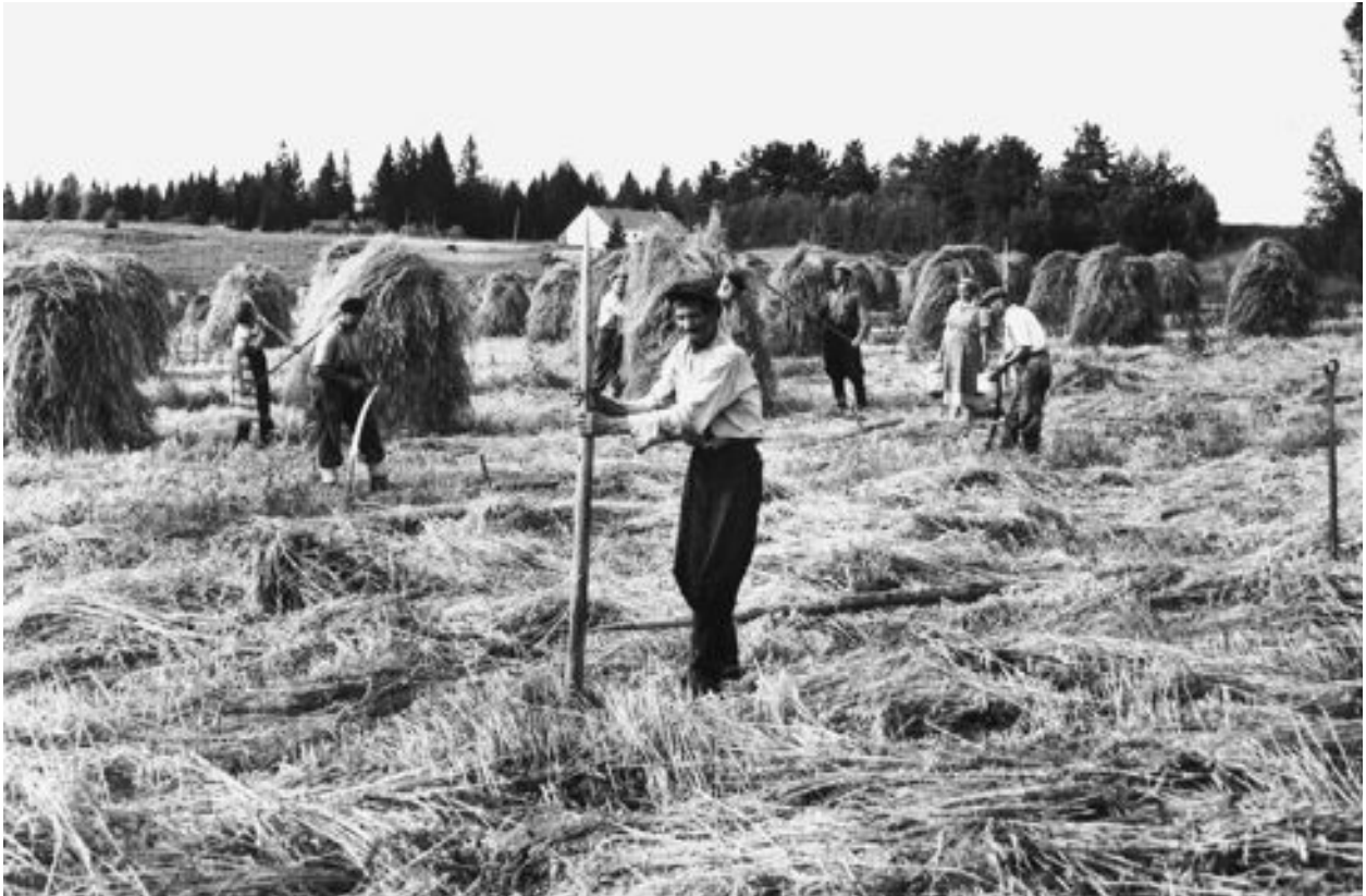
Urajärven kartanon maatöissä tarvittiin paljon väkeä. Tämä kuvan heinäkorjuusta on jo itsenäistyneen Suomen vuosikymmeniltä.

200 viljelijää. Kokous yhtyi Helsingissä tehtyihin päätöksiin, joissa mm. todettiin 8-tuntinen työpäivä mahdolliseksi maataloudessa.