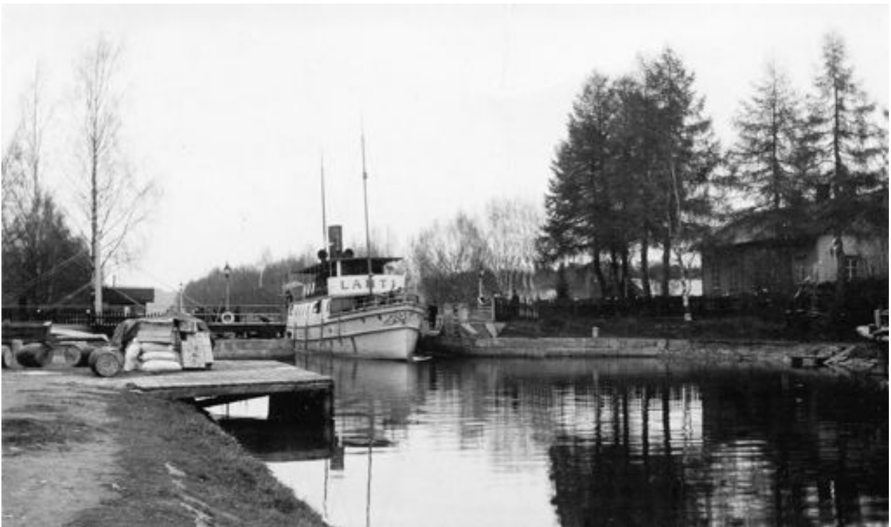
Levottomasta ajasta huolimatta laivaliikenne Vääksyn kanavalla oli vuonna 1917 vilkasta. Esimerkiksi lokakuussa kulki kanavan kautta 1 279 alusta ja liikenne jatkui jäiden tuloon eli joulukuun alkupäiviin saakka.