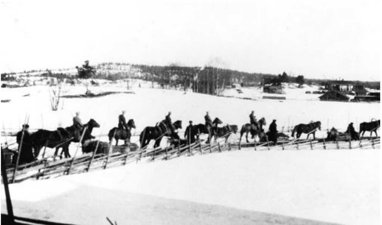
Vapaussodan miehistönkuljetuskalustoa. Siellä missä ei ollut rautateitä, käytettiin hevosia ja rekiä. Kymmenien hevosten kolonna ei vuonna 1918 ollut vieras näky.