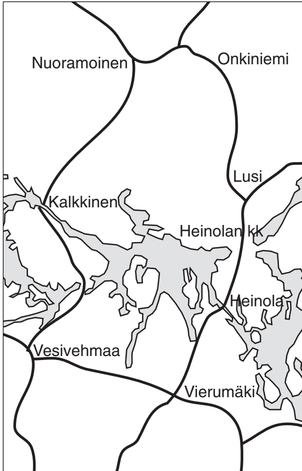
Helmi- ja maaliskuussa taisteltiin Heinolan ja Lusin omistamisesta. Heinola pysyi punaisilla, Lusi valkoisilla.