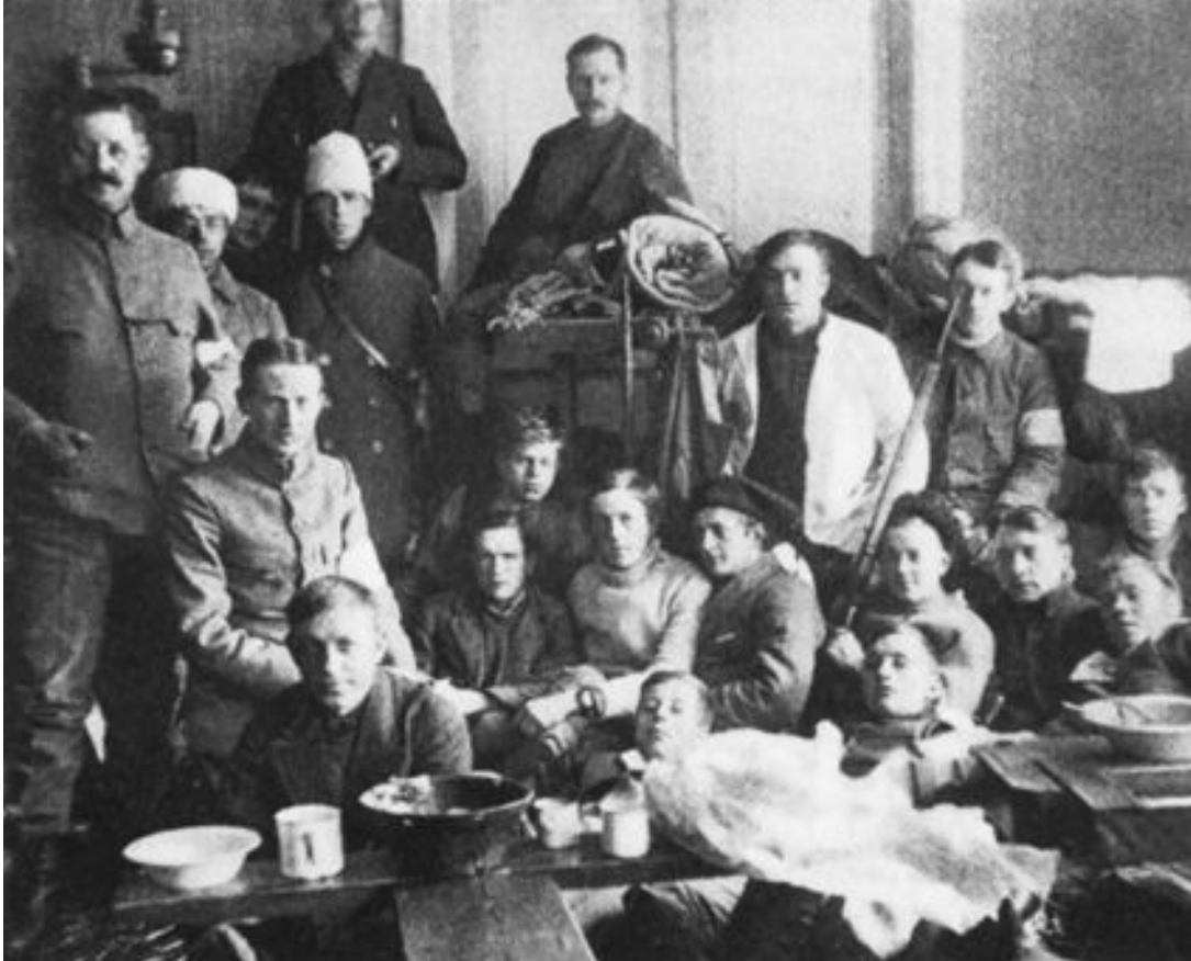
Valkoisia Sysmässä 27.2. Hyökkäys Heinolaan alkoi seuraavana aamuna.