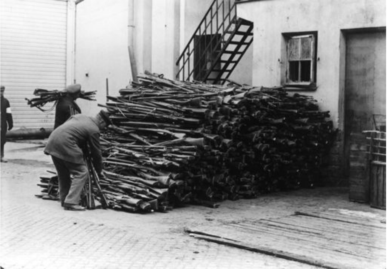
Sodan alkuvaiheessa aseista oli pulaa puolin ja toisin. Kevättä kohti aseiden määrä kasvoi. Tällaisia rökkiöitä kivääreitä kerättiin antautuneilta punaisilta Lahdessa.

yhdessä he saivat tuotua Pajarin omalle puolelle.