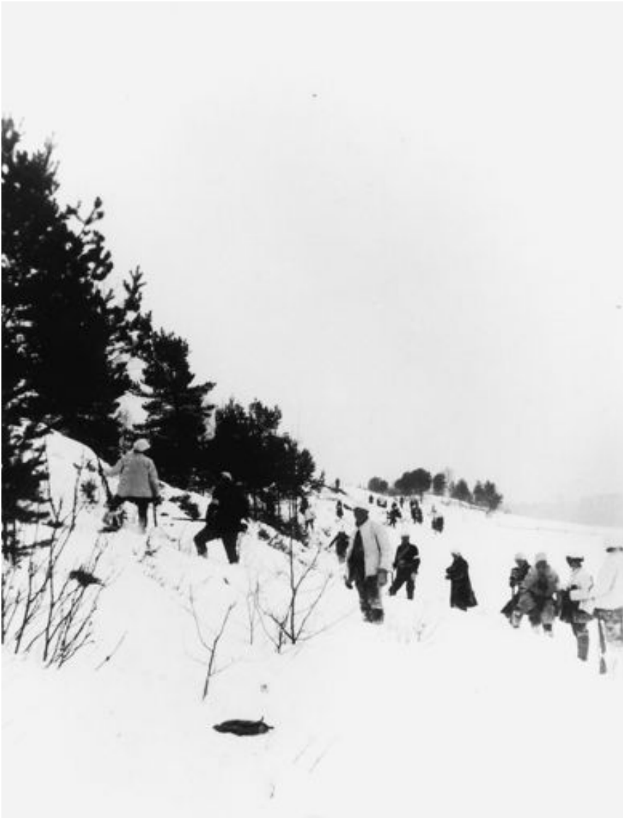
Valkoiset taistelun tauolla rinteiden päällä sijaitsevien asemien takana. Lumipukuja alkoi ilmestyä miesten päälle sodan edetessä. Tampereen taistelussa niitä oli vain päällystöllä, jolloin punaisten oli helppo napsia komentajat pois hyökkäävien valkoisten joukosta.

Vasta 14.3. valkoiset huomasivat Heinolan kirkonkylän tyhjäksi ja asettuivat sinne, missä heidän Mannerheimin aikanaan antaman puolustuskäskyn mukaan pitikin olla.