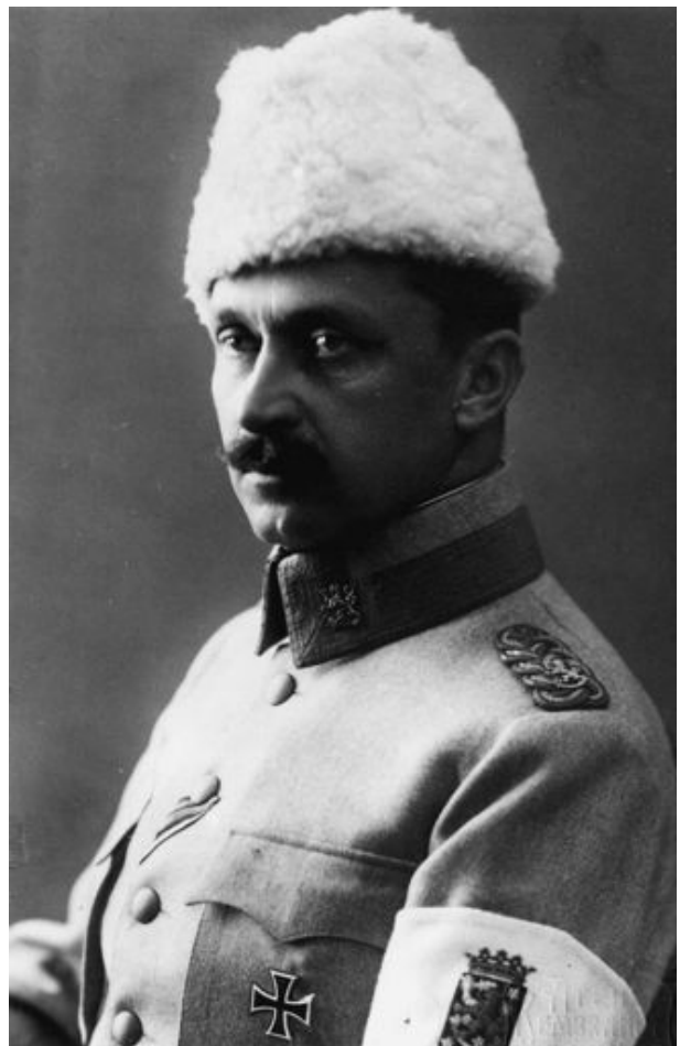
Valkoisten ylipäällikkö kenraali Carl Gustaf Emil Mannerheim.