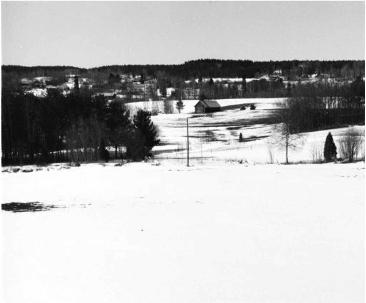
Kurhilan peltoaukea Laatikkaanmäen ja punaisten tykkiasemien suunnasta katsottuna. Kalmin joukkojen oli mahdotonta edetä avoimessa maastossa päiväsaikaan.

johti itse kohti Maakeskeä ja edelleen Kurhilaan.