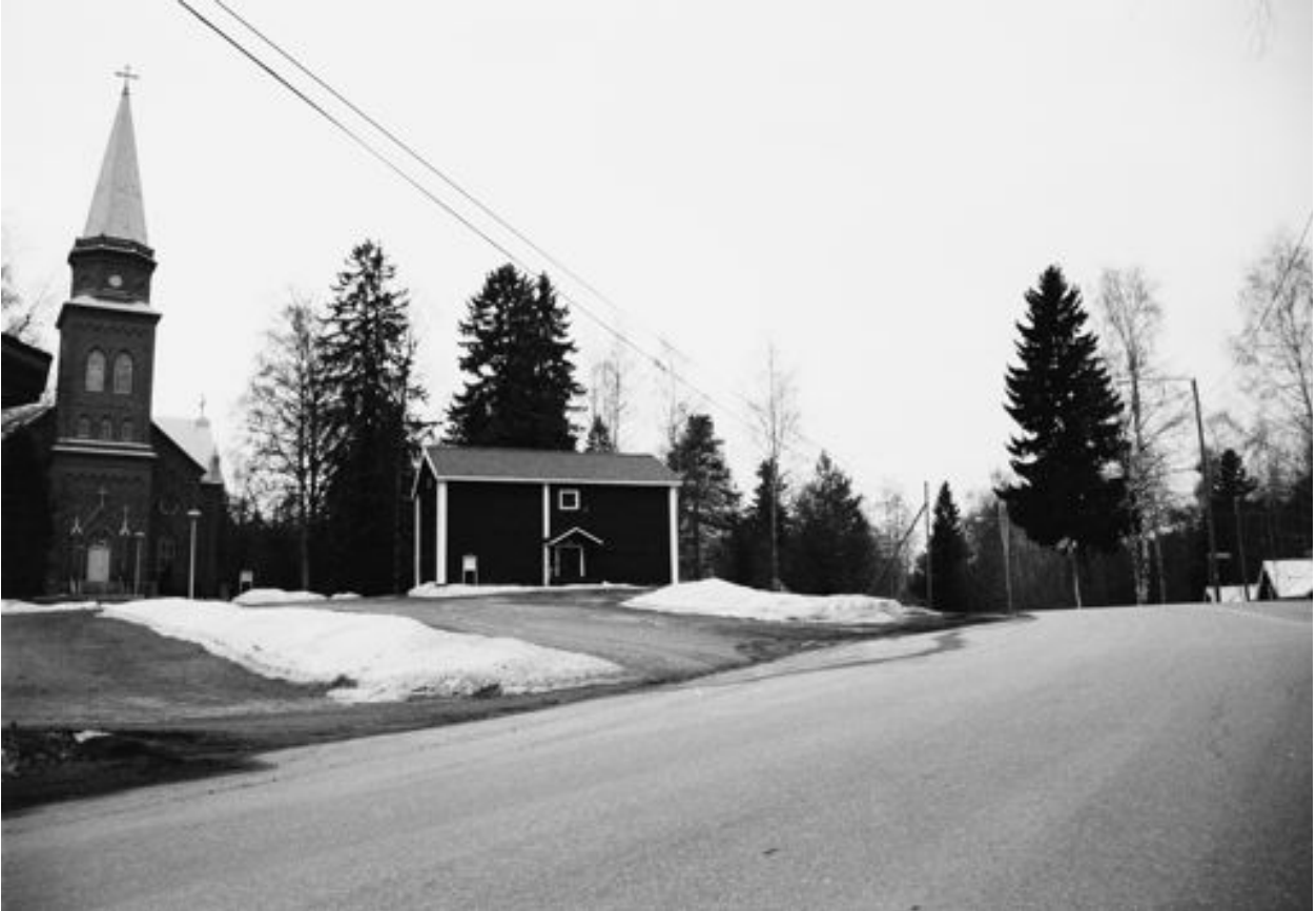
Tähän suuntaan tähtäsi pappilan takana ollut valkoisten konekivääri, kun punaiset hyökkäsivät Kirkonkylään Hillilän suunnasta.