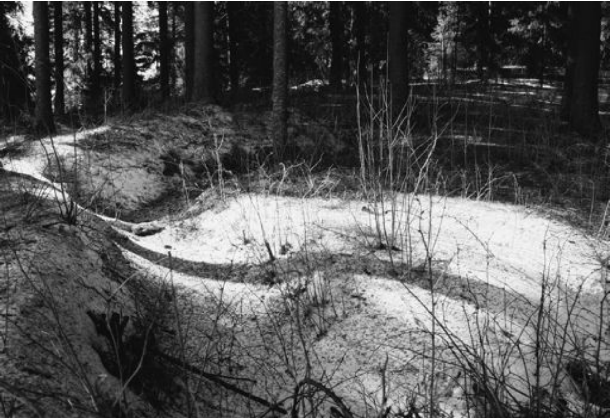
Laatikkaanmäellä Hillilässä juoksuhautoja on runsaammin kuin Kurhilan nuorisoseuran talon ympärillä. Peltojen ympäröimältä mäeltä oli vapaata ampuma-alaa joka suuntaan.