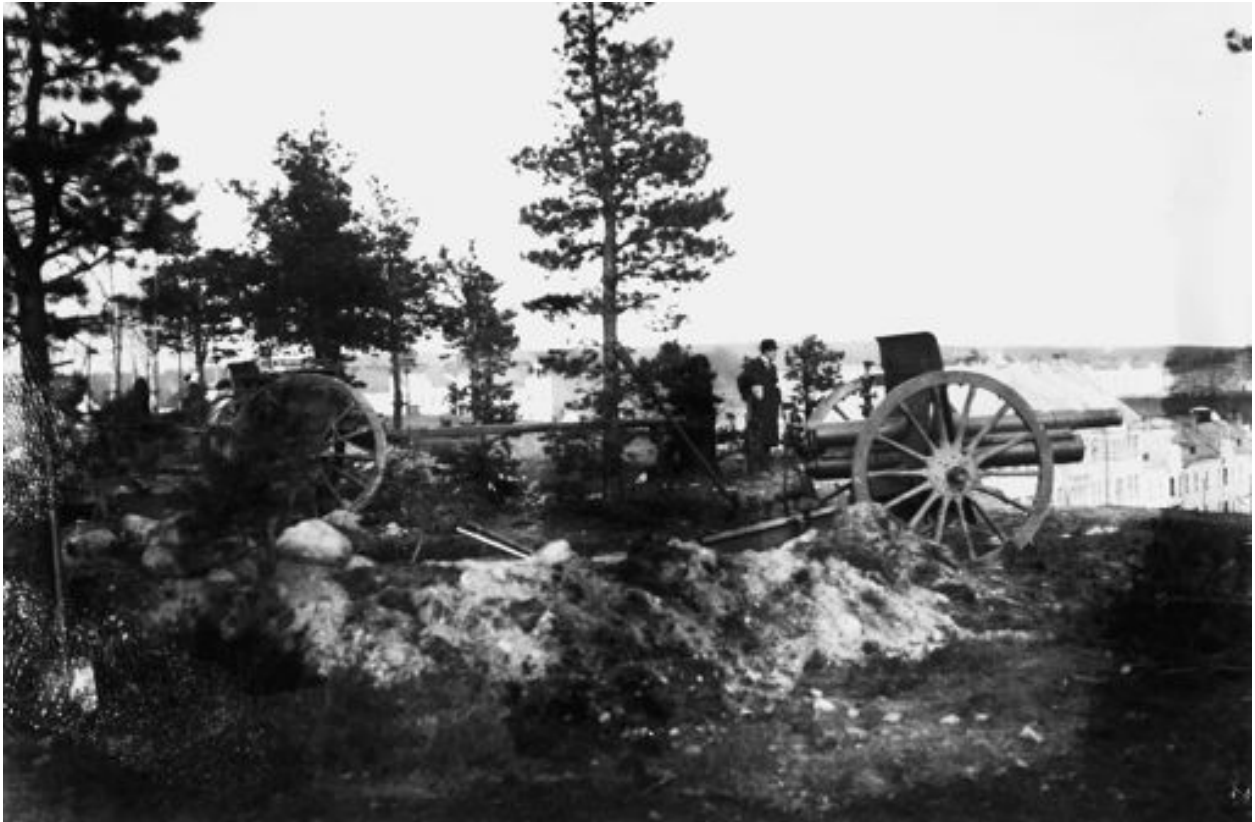
Nämä tykit olivat punaisilla käytössään Pulkkilassa ja Kalkkisissa. Ne vedettiin kuitenkin maaliskuun alkupuoliskolla Lahtea puolustamaan. Taustalla näkyy kaupunginsairaala.