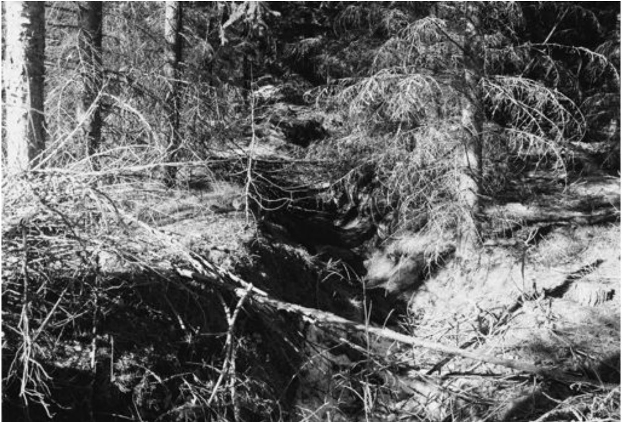
Kurhilan nuorisoseurantalon takana on pitkä pätkä hyvin säilynyttä juoksuhautaa. Ai-noastaan harvennushakkuut ovat sitä hieman tukkineet.

Suomennettuna: Majuri määrätään heti saapumaan armeijakunnan esikuntaan Elisenvaaraan.