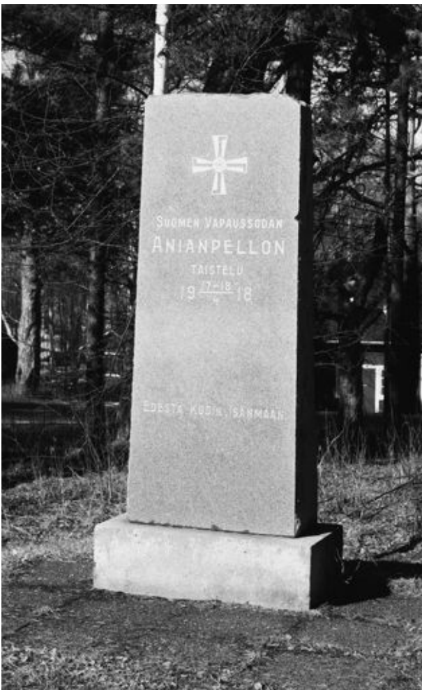
Anianpellon taistelun muistomerkki Kustaa III:n metsikössä Anianpellontien varrella. Se on pystytetty paikalle, jossa oli asemissa yksi valkoisten konekivääreistä.