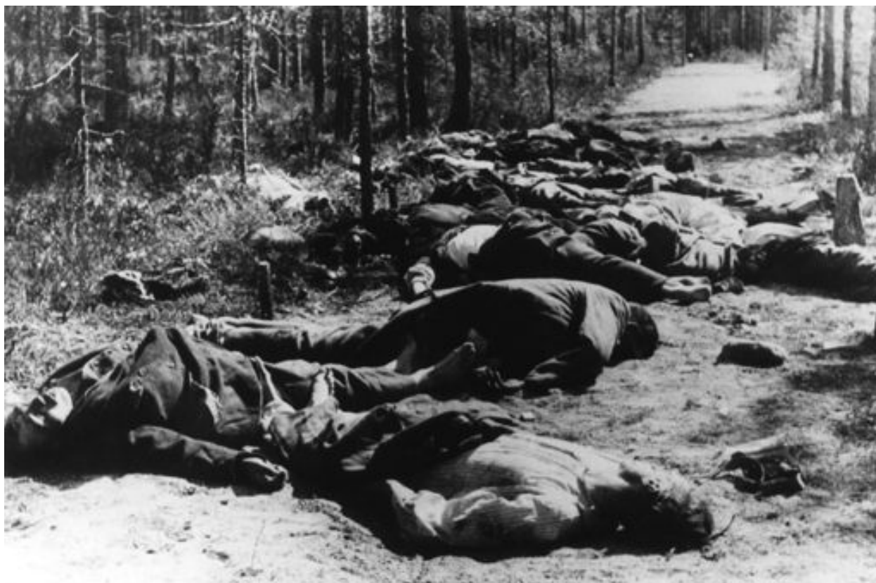
Teloitettuja punaisia Lahdessa. Vääksyn teloituspaiikka näytti paikkaa katsomaan rientäneiden koululasten silmiin lähes samanlaiselta. Tosin teloitettuja ei kerrallaan ollut kolmea, neljää enempää.