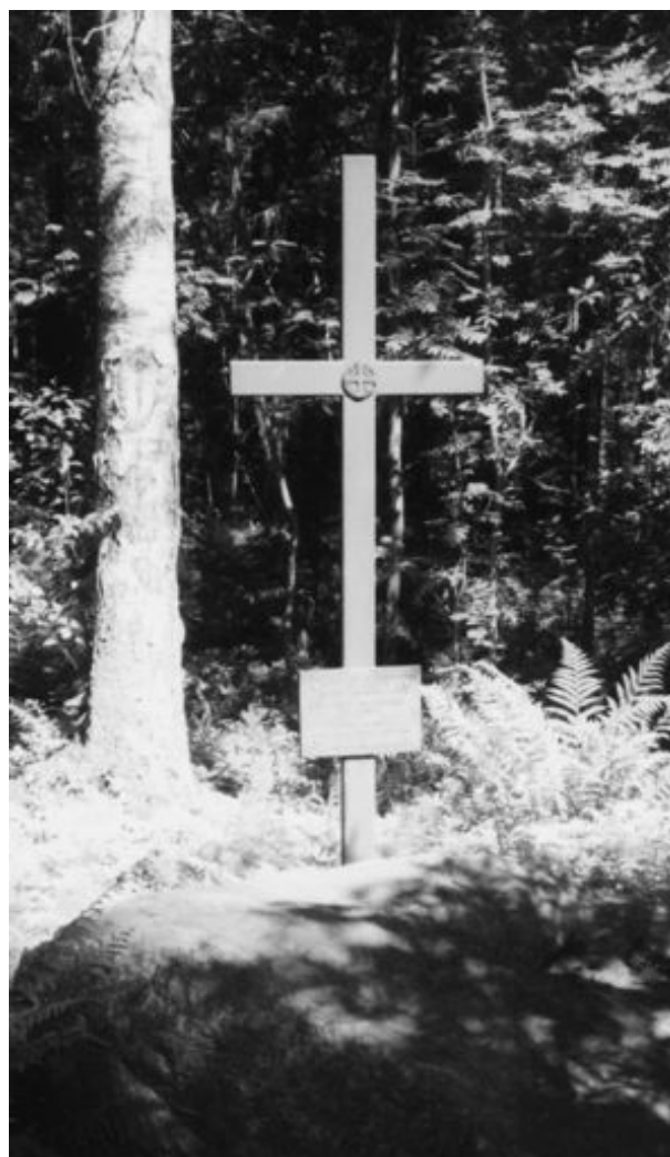
Karttusen surmapaikalle pystytetty metalliristi on syrjässä valtavylistä keskellä kuusimetsää.

Karttusta lähdettiin viemään kuulusteltavaksi Lahteen. Hänet kuitenkin ammuttiin talvitien varteen jo ennen Vesijärven rantaa. Vuonna 1994 kyläläiset pystyttivät surmapaikalle muistoristin.