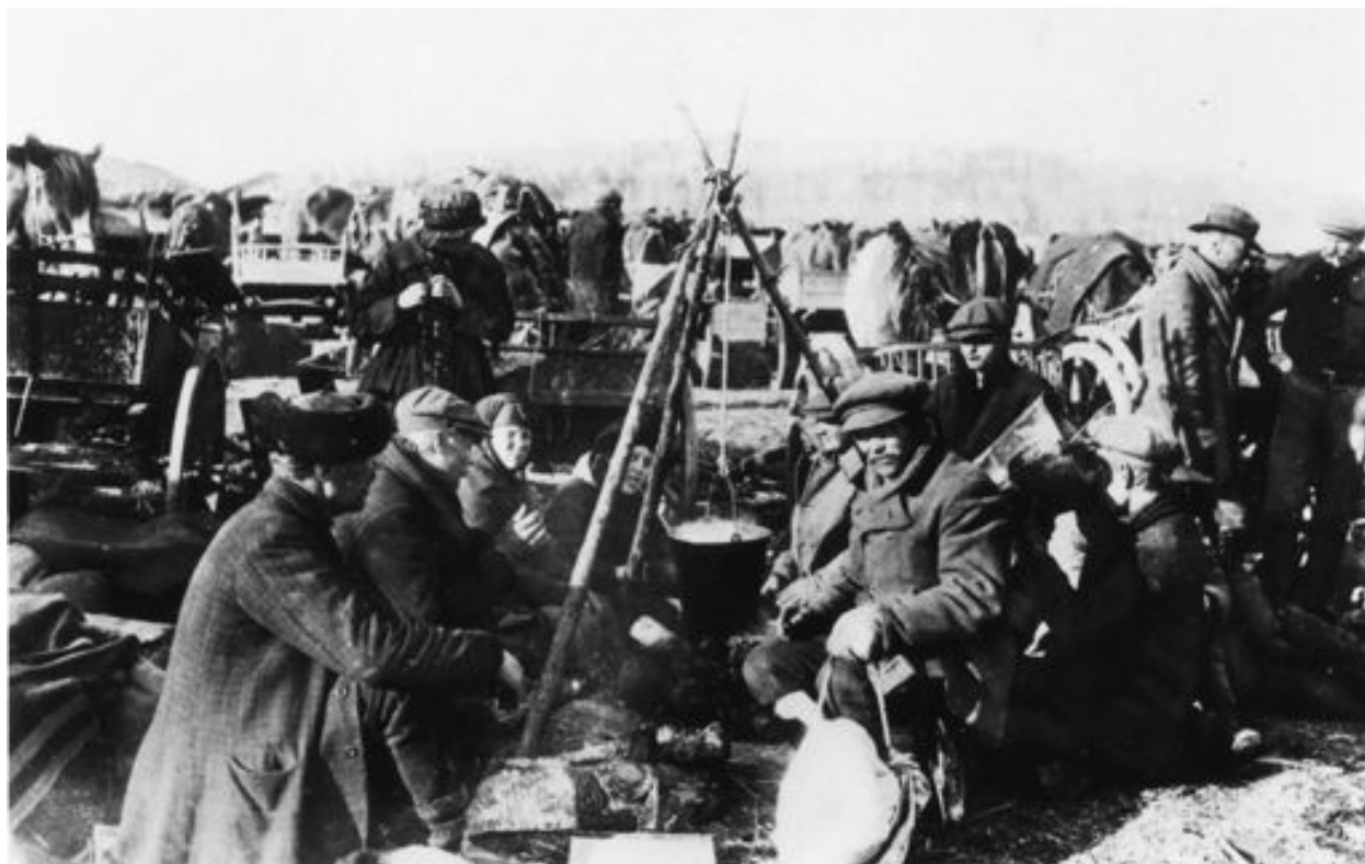
Fellmanin pellon vankileiriltä Lahdesta eri pitäjien miehet etsivät tuttuja joko pelastaakseen heidät tai viedäkseen heidät teloitettavaksi.