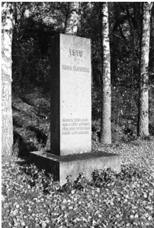
Punaisten muistomerkki Asikkalan hautausmaalle pystytettiin kesällä 1947. Silloin viimeisetkin taisteluissa kaatuneiden ja teloitettujen ruumiit sirettiin sinne.

ty juuri muuta kuin kerran Kirkonkylään tehty tiedusteluretki.