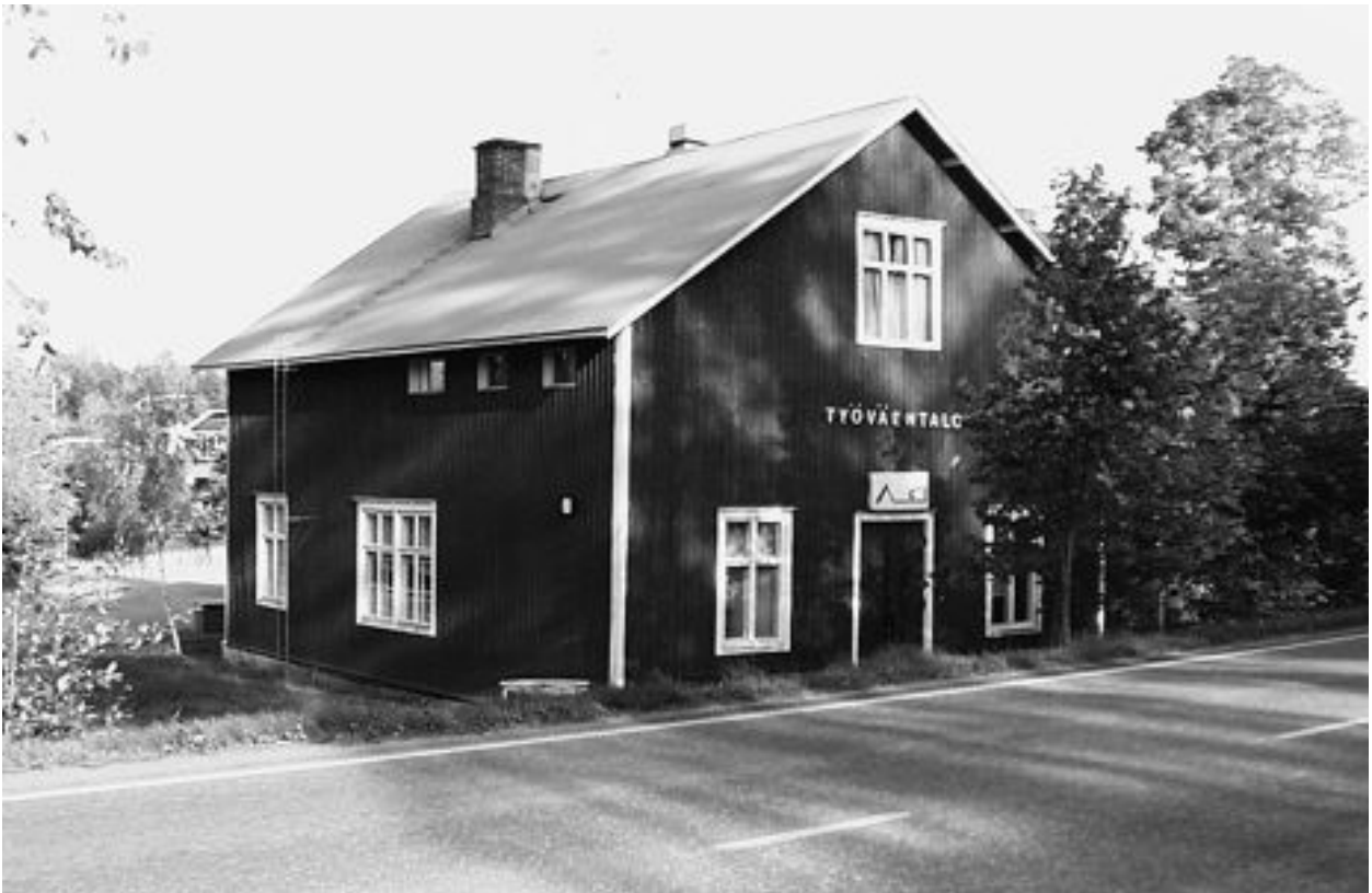
Anianpellon työväenydistyksen talo tunnetaan nykyisin Vääksyn Torppana. Vuonna 1918 rakennus oli nykyistä pienempi. Taloa käytettiin tuomiotaan odottavien punakaartilaisien vankilana.