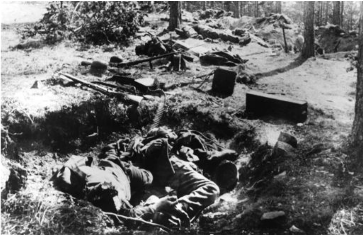
Sodan ratkaisutaistelut Lahdessa ja sen ympäristössä olivat verisiä. Kaatuneita punaisia Salpausselällä.

Valkoisen terrorin uhreja Asikkalassa on huomattavasti enemmän kuin punaisen terrorin. Teloitettuja oli valkoisten terrorista kertovaan kirjaan kirjattu 51, heistä kaksi